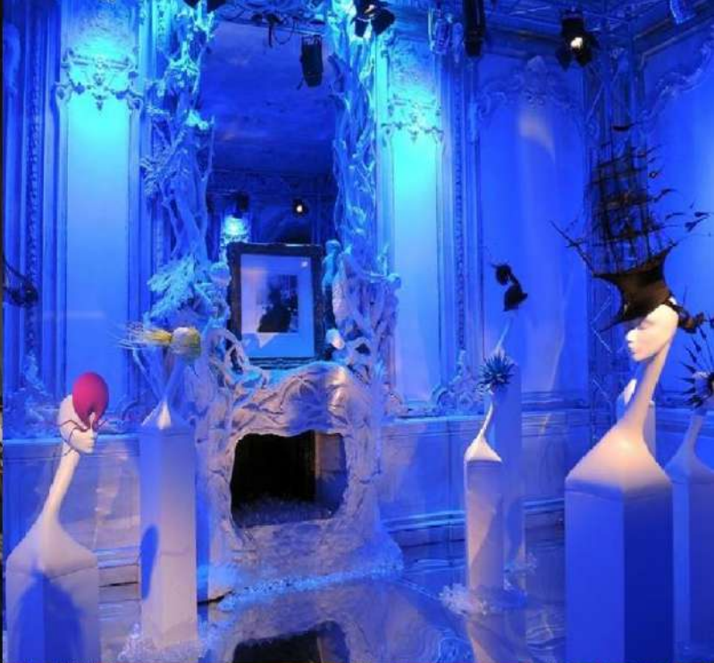
ФОТО ПРОВЕДЕННЫХ МЕРОПРИЯТИЙ

Наша усадьба позволяет проводить любые мероприятия от балов до модных показов в атмосфере XIX века.